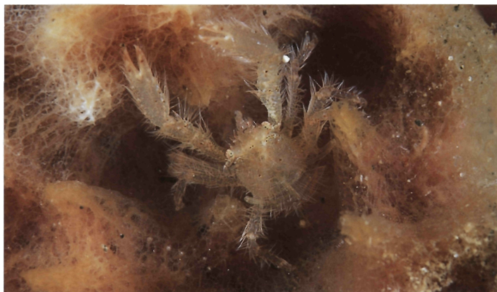
雄 / 静岡県 (大瀬崎) / 水深: 14m / 甲長: 0.6cm

岩礁の礁斜面の岩肌に生えるザラカイメンやワタトリカイメン, ミズガメカイメンなどに共生し, 宿主が枝別れする基部や外側のひだなどに, たいてい雌雄で隠れすむ。体色は, 半透明の淡黄色。長毛でおおわれる。雌では白と赤の隣接する斑点がまばらに散在するが, 雄の斑点は不鮮明。眼に赤褐色の斑点が散在する。