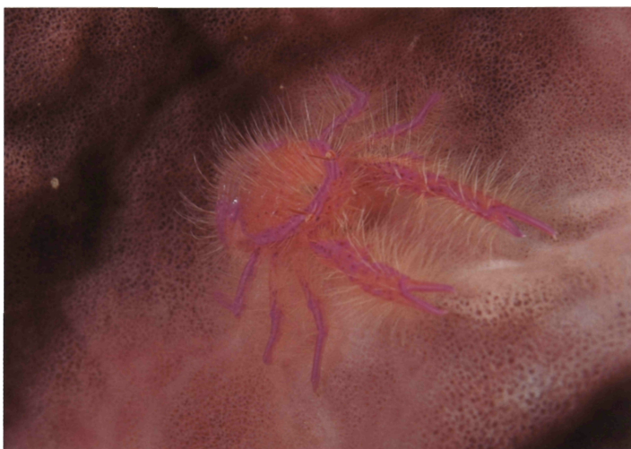
インドネシア (バリ島) / 水深: 20m / 甲長: 1cm