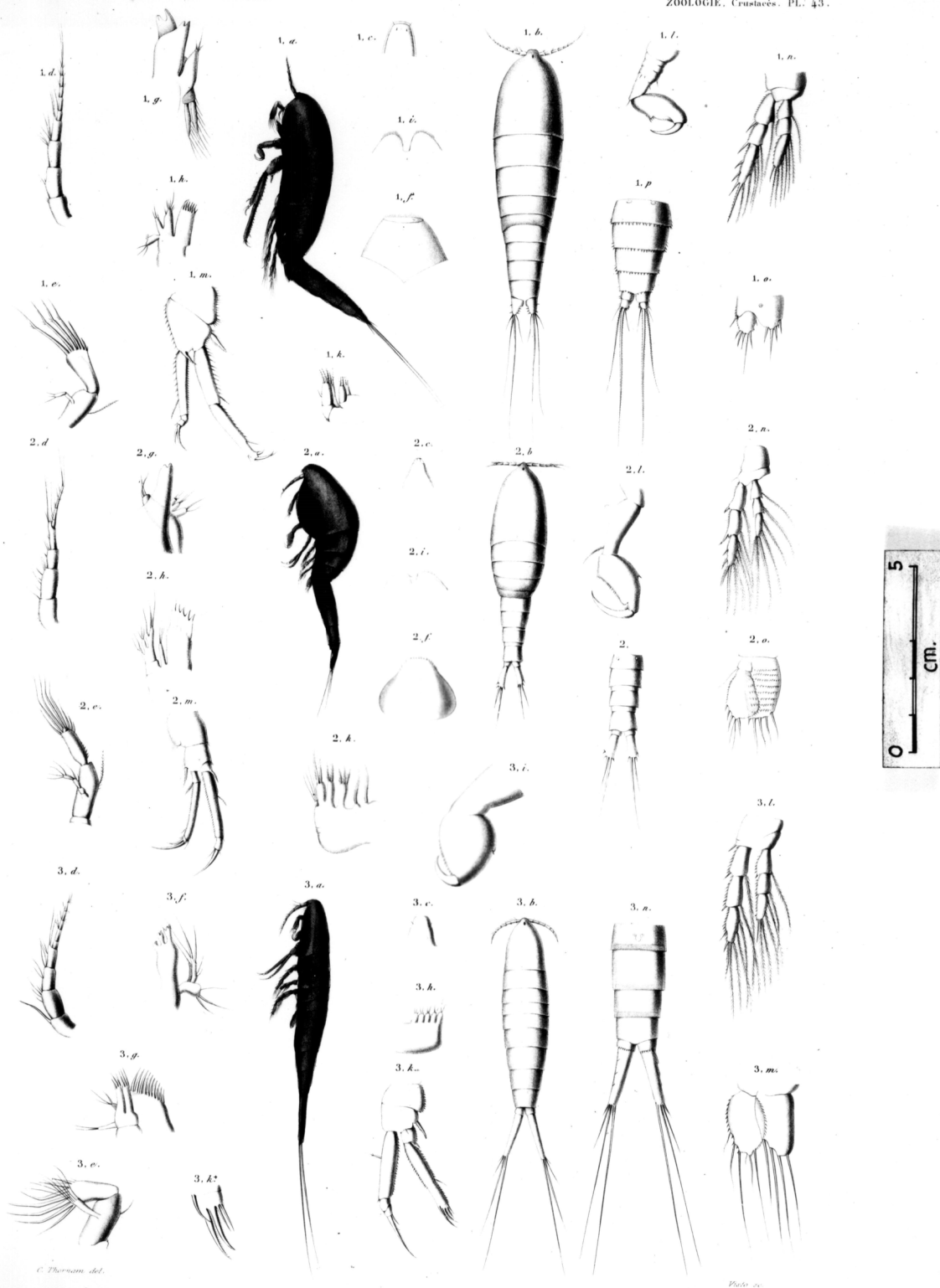
Fig. 1. a. p. HARPACTICUS UNIREMIS, Kr. n. sp. Fig. 2. a. p. HARPACTICUS GIBBUS, Kr. n. sp. Fig. 3. a. p. HARPACTICUS CROSI, Kr. n. sp.